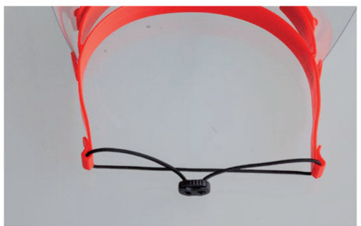
6. Gummikordel beidseitig in Trägerbügel einhängen. Kordellänge an Kopfumfang anpassen.