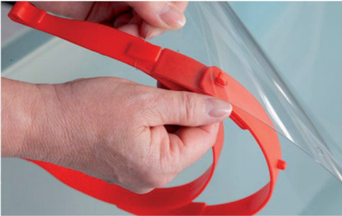
1. Klarsichtschild mit Langloch in äußeren Haken des Trägerbügels einhängen bzw. einrasten.