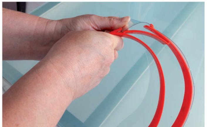
4. Klarsichtschild auf beiden Seiten in V-förmige Halter des Trägerbügels einstecken.