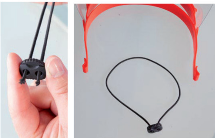
5. Beide Enden der Gummikordel durch den Stopper führen. Dazu Druckknopf komplett eindrücken. Beide Enden mit einem Knoten versehen.