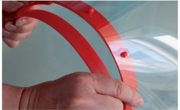
2. Die beiden mittleren Rundlöcher in die runden Zapfen des Trägerschildes eindrücken.